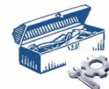
La caixa d'eines